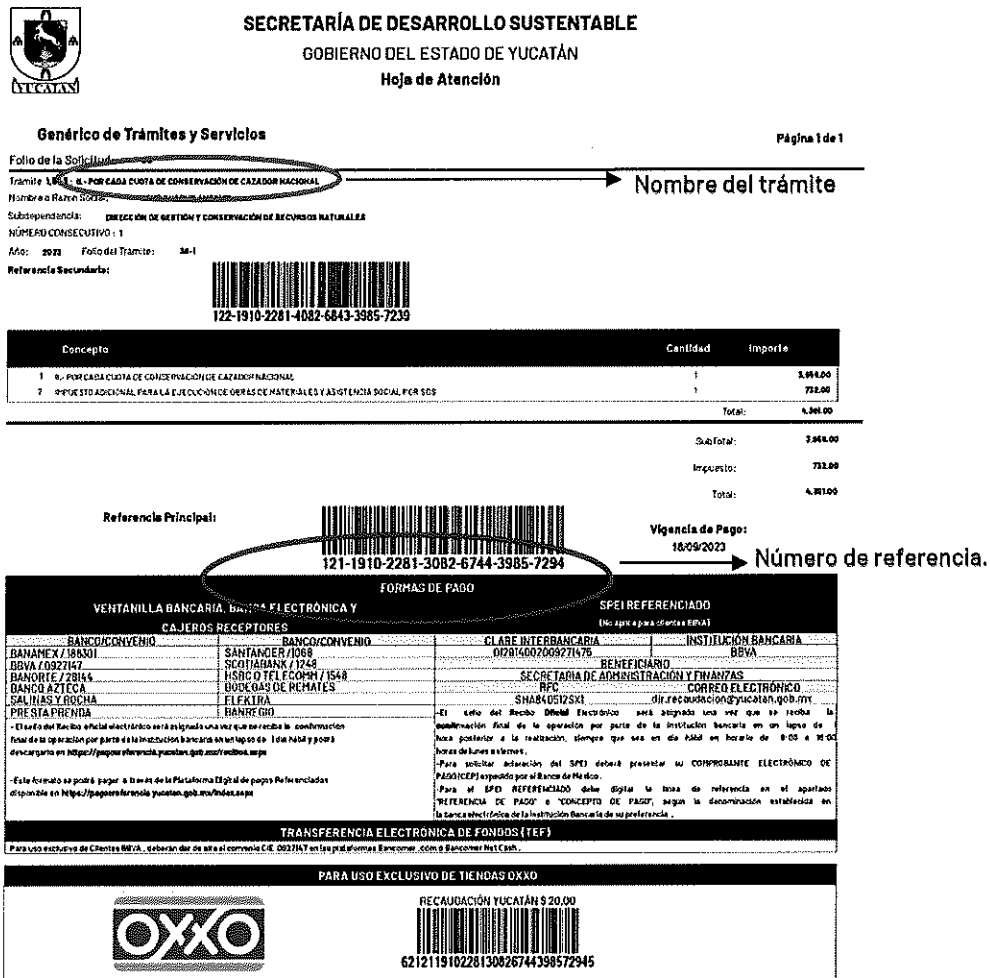
Imagen 1. Ejemplo de "HOJA DE ATENCIÓN, emitida por la AAFY

Para el SPEI REFERENCIADO debe digitar la línea de referencia en el apartado "REFERENCIA DE PAGO" o "CONCEPTO DE PAGO", según la denominación establecida en la banca electrónica de la Institución Bancaria de su preferencia.